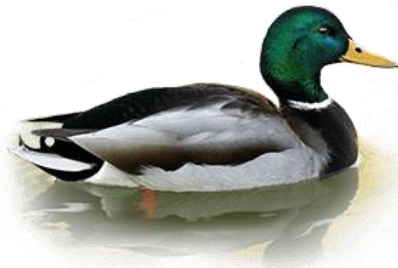
Селезень кряквы (Anas platyrhynchos)

Мы обращаемся к Вам с убедительной просьбой ответить на вопросы, приведенные на обороте этого листа. Ваши ответы помогут оценить объем добычи одного из самых популярных объектов охоты – кряквы. Пожалуйста, укажите точное количество отстрелянных Вами селезней кряквы по итогам весеннего сезона. Важны все результаты, поэтому заполните эту анкету даже в тех случаях, когда Вы получили разрешение на добычу селезней уток, но не охотились, или же Вам не удалось отстрелять ни одного селезня кряквы.