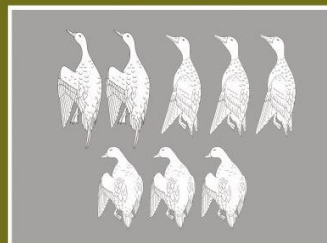
Пример 3: Группировка по внешнему виду